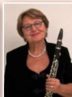
Lux Brahn Klarinette