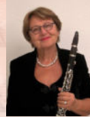
Lux Brahn Klarinette