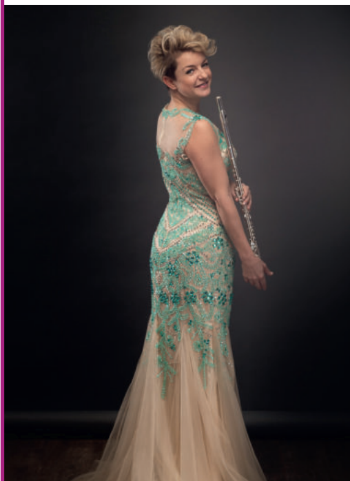
Blanka Kerekes Querflöte

Eine der prominentesten Querflötistinnen der Welt